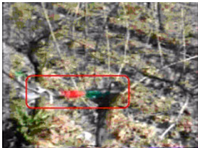
Figure 5.- Photo 3

La séquence 3 résume et illustre ces deux types de lecture. Des aspects contingents au cep sont traités et explicités par l'opérateur. La position de la baguette qui est sauvegardée est atypique en relation au placement habituel. La baguette et surtout le rappel préparent la taille de l'année suivante et fonctionnent comme repères pour le tailleur de la campagne successive (dans la Photo 3 le sécateur indique le rappel).