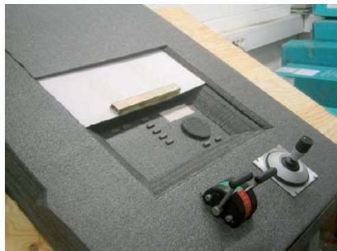
Figure 3 : La façade coulissante, et le pilote (CTP : course-and track pilot).

le résultat de conception était la « façade coulissante », comme présenté sur le schéma 3.